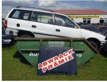
Auf den Container und ab nach Afrika? Angeblich werden viele abgewrackte Autos illegal weiterverkauft. (Symbolbild)

So dürfte der schleppende Absatz, der den deutschen Markt lange vor der Finanzkrise auszeichnete, unter anderem in den hohen Preisen begründet sein: Autos kosten in Deutschland mehr als in einigen vergleichbaren Staaten, selbst mehr oder weniger identisch ausgestattete Modelle. Vor allem der Vergleich zu den USA ergibt deutliche Mehrpreise selbst für deutsche Autos, die hierzulande gefertigt werden. Gleichzeitig stehen den Preiserhöhungen der vergangenen Jahre Nettoeinkommens-Einbußen gegenüber – eine Diskrepanz, die der Handel nur ausgleichen kann, indem er aus den hiesigen Preisen die Luft ablässt.