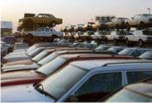
Nach dem Ende Abwrackprämie müssen Autokäufer Rabatte erhandeln.