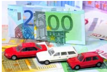
Je weniger Anträge auf die Umweltprämie eingehen, desto mehr ersetzen Hersteller die staatliche Unterstützung

Seit Mittwoch ist der 5-Milliarden-Etat erschöpft und die Abwrackprämie damit Geschichte. Kein Windhundrennen mehr auf das 2500-Euro-Geschenk, für das ein mindestens neun Jahre altes Auto abgewrackt werden musste. Rund zwei Millionen Käufer kamen in den Genuss. Keine psychologischen Thesen mehr über wahnwitzige Käufer, die sogar Fahrzeuge in höherem Wert als 2500 Euro verschrotteten, um vom Staat weniger Geld zurückzubekommen. Keine Diskussion mehr über den volkswirtschaftlichen Sinn, massenhaft funktionsfähige und überwiegend saubere (Katalysator-)Autos zu zerstören. Keine Empörung der Politik mehr darüber, dass findige Händler bis zu 50 000 Altagautos nicht verpressten, sondern verkauften: in die Entwicklungsländer, wo sich Gebrauchtwagen aus Deutschland hoher Wertschätzung erfreuen. Kein Klagen deutscher Premiumhersteller mehr, sie würden von der Prämie nicht profitieren. Gewinner seien vor allem die Hersteller und Importeure günstiger Kleinwagen. Gewinner ist außerdem Vater Staat, der alleine über die Mehrwertsteuer der zusätzlich verkauften Autos die Prämie schon wieder hereinbrachte. Gewinner sind all jene Menschen, die sich ohne die Prämie nie und nimmer einen Neuwagen gekauft hätten (und die Banken, die gute Geschäfte mit diesen Kunden machen, die sich das fehlende Geld geborgen haben).