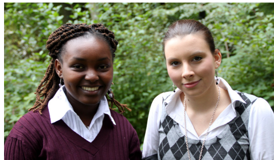
Unsere studentischen Hilfskräfte