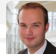
Marcel Hafke (FDP) Mitglied des Landtages NRW