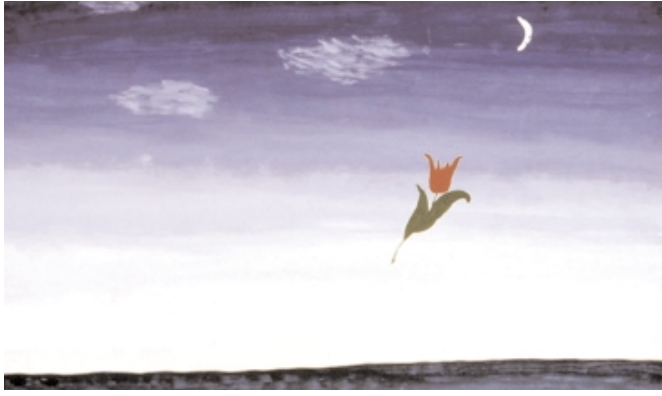
▲ Abb. 1: Für ihre Leistung, dass sie den Hunger überwunden haben, wollen Anorektikerinnen bewundert werden. Das Bild einer Blume, das die Patientinnen oft so in der Gestaltungstherapie malen, drückt diesen narzisstische Zug gut aus.