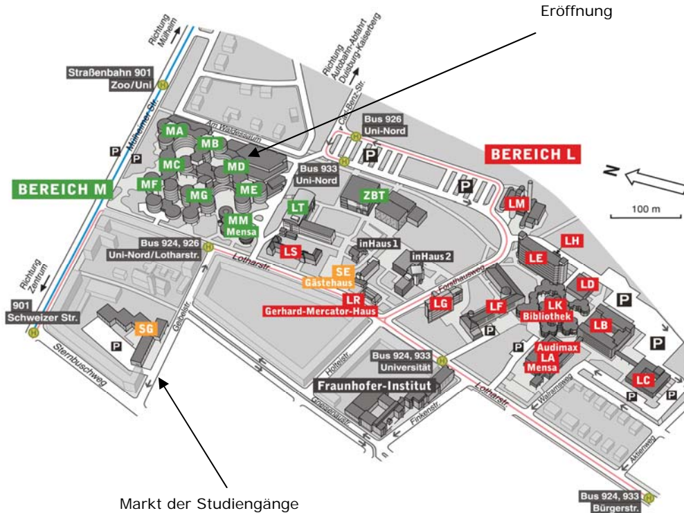
Markt der Studiengänge

Der L- und M-Bereich des Campus Duisburg ist durch die Buslinien 924 und 933 (Haltestellen „Universität“, „Uni Nord Lotharstraße“ bzw. „Uni-Nord“) zu erreichen. Außerdem können Sie die Straßenbahnlinie 901 Richtung Mülheim nutzen. Steigen Sie an der Haltestelle „Schweizer Straße“ oder „Zoo/Uni“ aus. Sie befinden sich dann auf der Mülheimer Straße und müssen in die Lotharstraße einbiegen.