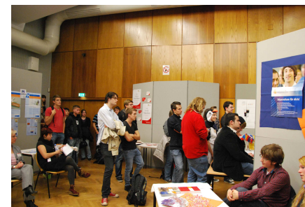
ERASMUS Schreibwerkstatt IBZ Universitätsbibliothek Und Viele mehr ...