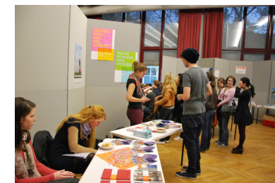
BVM Berrufsverband Deutscher Markt- und Sozialforscher e.V.