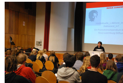
Ferchau GmbH G.I.B. Gesellschaft für innovative Beschäftigung