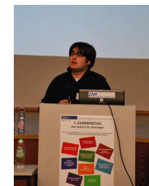
A.S.I. Wirtschaftsberatung AG Studienstiftungen Akademisches Beratungszentrum Studium und Beruf