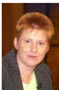
Petra Pau stellv. PDS-Vorsitzende