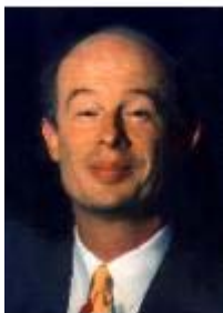
Hans-Joachim Schellnhuber Klimafolgenforscher