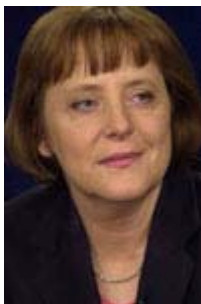
Angela Merkel CDU-Vorsitzende

Ich selbst habe auch meinen Wahlkreis in Mecklenburg-Vorpommern und da weiß man ja, was alles geschaffen wurde, wie lange das gedauert hat und wie schwer es die Selbstständigen auch haben. Es ist schon dramatisch für viele, weil es unendlich viel Kraft, unendlich viel Elan gekostet hat. [...] Jetzt wieder diese Ungewissheit. Das Leben nach der Wende war ja schon für viele mit soviel Neuerungen verbunden, mit soviel Ungewissheiten, und ich bin deshalb auch besonders beeindruckt, dass viele in den anderen Neuen Bundesländern unglaublich solidarisch sind. [...] Wir haben uns jetzt vorgenommen, dass wir von unseren geplanten Anzeigen nur die Hälfte machen und