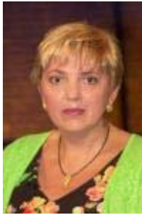
Claudia Roth Bundesvorsitzende B'90/Die Grünen

Es gibt Dinge, die gehören zum Grundkonsens der Demokratie und die dürfen nicht in den Wahlkampf.