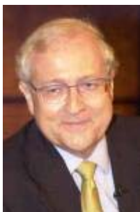
Rainer Brüderle stellv. Vorsitzender der FDP-Bundestagsfraktion

Ich würde lieber über die Frauenpolitik sprechen, für die der Herr Schröder steht und für die der Herr Stoiber steht. Und wieder haben wir diese wunderbare Alternative. Herr Stoiber schlägt vor zum Beispiel, dass jetzt ein Familiengeld eingeführt wird, 600 Euro. Ich würde sagen, das ist eine Herdprämie, um die Frauen schön zu Hause zu belassen.