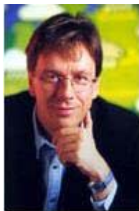
Jörg Kachelmann Meteorologe

In Deutschland sind wir sicherlich nicht führend, was die Warnung vor Naturkatastrophen angeht. Das hat angefangen am Sonntag, als der staatliche Wetterdienst, der eigentlich zuständig ist für solche Warnungen, dummerweise nur eine Vorwarnung zu einer Unwetterwarnung herausgegeben hat. Die hatte eine Fußnote, in der drinstand, dass es noch zu früh sei, genaueres zu sagen und dass später etwas genaueres käme. Am Montag haben wir vom MDR- und ARD-Wetterstudio aus geschrieben, dass es eine Katastrophe ungeahnten Ausmaßes und ein Jahrhunderthochwasser geben würde. Aber das ist dann von den Behörden immer noch nicht