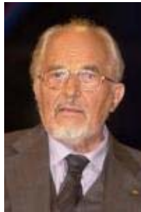
Rainer Barzel ehem. CDU-Vorsitzender

Ich habe den großen Vorteil, beide Kandidaten zu kennen. Und ich war überrascht, dass Stoiber doch recht schlagkräftig war und teilweise sehr charmant. Und ich war erfreut, dass der Bundeskanzler, dem man die Anspannung dieser Tage ansah, so sachlich blieb. [...] Wenn ich mich selbst frage, als Wähler, dann komme ich mir ein bisschen vor wie Faust bei Goethe: "Da steh ich nun, ich armer Tor und bin so klug, als wie zuvor." Denn ich kriegte ja gar keinen Wahlzettel, wo die beiden Namen