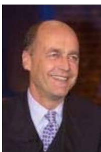
Laurenz Meyer CDU-Generalsekretär

Ich glaube nämlich in der Tat, dass aus vielen rechtlichen Gründen der Spielraum beim Familiensplitting viel kleiner ist, als das unser Koalitionspartner sich das gegenwärtig noch vorstellt. Und das werden wir deshalb auch im Einzelnen diskutieren.