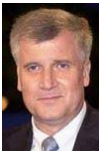
Horst Seehofer Stellvertretender CSU-Chef

Ich bin ja nicht erst seit einem Jahr in der Politik, sondern seit über 20 Jahren. Und ich glaube ohnehin, dass man jetzt nicht mit mir eine große Vorstellung machen muss, sondern wir werden bei meiner Präsentation auch ein inhaltliches Konzept für Renten, Gesundheit und Arbeitslosenhilfe präsentieren.