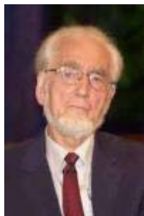
Erhard Eppler SPD-"Urgestein"

Ich wehre mich immer, wenn man sagt, dies und das gehört nicht in den Wahlkampf. Ist es denn was Schlimmes der Wahlkampf? Es ist eine Hochzeit der Demokratie! Das Gespräch derer, die ein Mandat erwerben, mit den Wählerinnen und Wählern. Da gehört alles 'rein, was die Menschen interessiert.