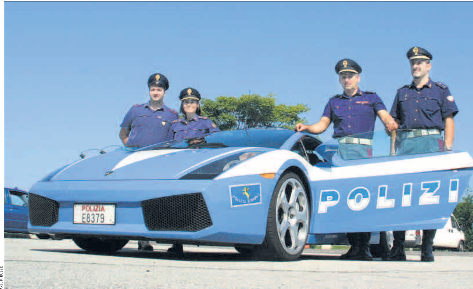
Wirtschaftskrise, leere Staatskassen – egal. In Italien leistet sich die Polizei weiterhin Lamborghinis. Die braucht sie auch, denn die Verkehrssünder sind schnell unterwegs

Die Liga der Luxusautos beginnt bei 200 000 Euro. Dort tummelt