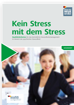
Kein Stress mit dem Stress Qualitätskriterien für das betriebliche Gesundheitsmanagement im Bereich der psychischen Gesundheit