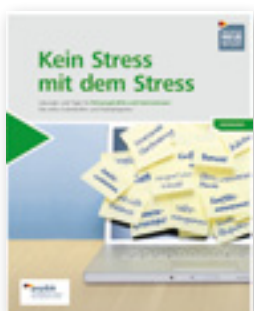
Kein Stress mit dem Stress Sammelordner mit Lösungen und Tipps für Führungskräfte und Unternehmen