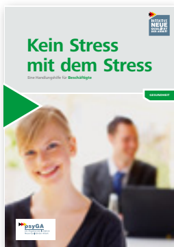
Kein Stress mit dem Stress Eine Handlungshilfe für Beschäftigte