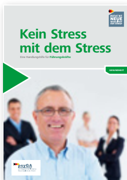
Kein Stress mit dem Stress Eine Handlungshilfe für Führungskräfte