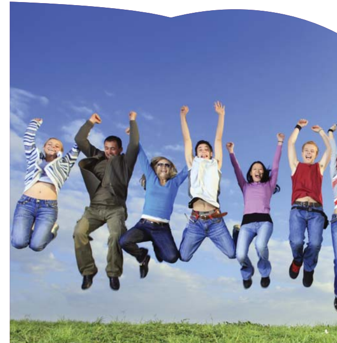
» Förderangebote für Existenzgründer/innen