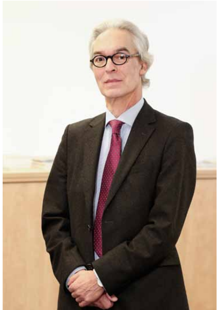
Dekan/Dean: Prof. Dr. Horst Bossong

Eine bedeutende strukturelle Entwicklung stellt die Gründung des „Methodenzentrums Qualitative Bildungsforschung“ dar (MzQB, Sprecherin des Gründungsrates Böhme), durch die vorhandene Expertise gebündelt wird und die Bedeutung qualitativer Methoden in der Bildungsforschung, im Bereich der Nachwuchsförderung und in den bildungswissenschaftlichen Studiengängen gestärkt werden sollen. Mit der Einwerbung des Datenarchivs Kindheit und Jugend im urbanen Wandel wurde in diesem Zusammenhang eine Grundlage für empirische Studien zu Fragen des Aufwachsens im historischen und aktuellen Kontext geschaffen.