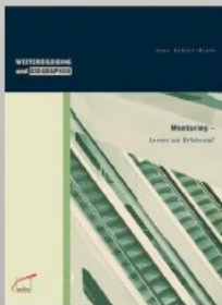
Ines Schell-Kiehl: Mentoring: Lernen aus Erfahrung?