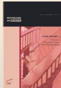
Anne Schlüter (Hrsg.): „In der Zeit sein...“