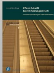
Anne Schlüter (Hrsg.): Offene Zukunft durch Erfahrungsverlust?