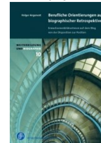
Holger Angenent: Berufliche Orientierung aus biographischer Perspektive