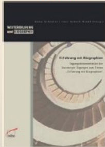
Anne Schlüter/Ines Schell-Kiehl (Hrsg.): Erfahrung mit Biographien