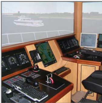
Der Flachwassersimulator soll Spritsparen lehren.

► https://www.uni-due.de/de/presse/meldung.php?id=8300