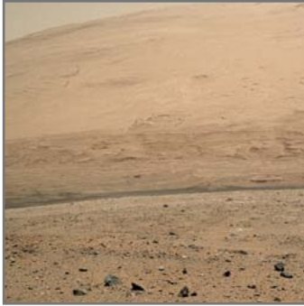
Der Boden des Mars funktioniert als Gaspumpe.

nensystem kann das. Diesen bislang unbekanntem Mechanismus konnten AstrophysikerInnen der UDE jetzt experimentell nachweisen.