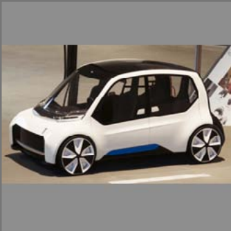
Das 3D-Modell. © Sabrina Neef

kunft des Straßenverkehrs – und die soll den Elektro-Autos gehören, wünschen sich die ProjektteilnehmerInnen. Dazu haben sich ForscherInnen der UDE, der Folkwang Universität der Künste und der Ford-Werke GmbH zusammengetan.