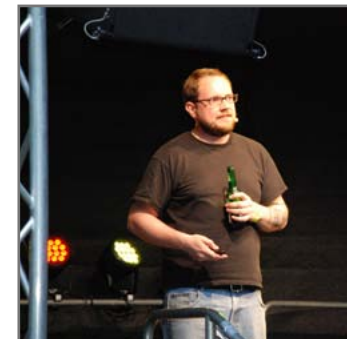
Science Slammer Remfort in Action.

► https://www.uni-due.de/de/presse/meldung.php?id=8301