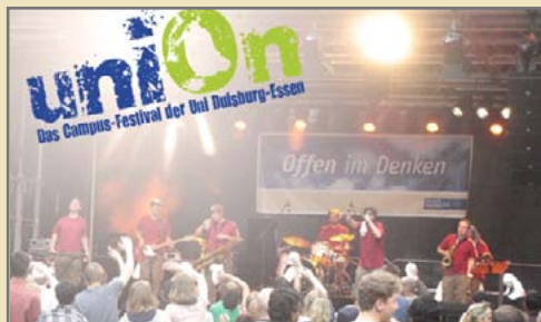
Auf geht's zum „uniOn“.