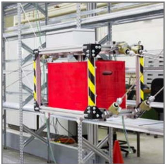
Seilroboter in einem Hochregallager.

Eine campusnahe, zeitlich flexible Betreuung für ihre Kleinen: Das ist es, was studierende Eltern brauchen. Bei den „Tiegelkids“ in Essen bieten das Studentenwerk und der Elternservice genau das an. Tageweise und wenn nötig auch von 16 bis 20 Uhr in der Kurzzeitbetreuung. Drei Tagesmütter kümmern sich um →