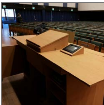
Saniert und medientechnisch aufgerüstet: der große Hörsaal im Duisburger Audimax. © ZIM

► http://www.startup.wiwi.uni-due.de/angebote/erstberatung/