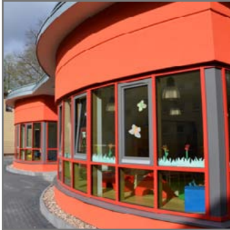
Schön bunt Das Gebäude der „Tiegelkids“.

unter Dreijährige. In den späten Nachmittags- bzw. frühen Abendstunden finden Kinder im Alter von vier Monaten bis zwölf Jahren einen Platz. Die Einrichtung wurde jetzt eingeweiht.