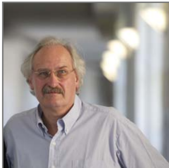
Gastredner Prof. Axel Honneth.

► http://www.uni-due.de/geisteswissenschaften/mitteilungen/bericht