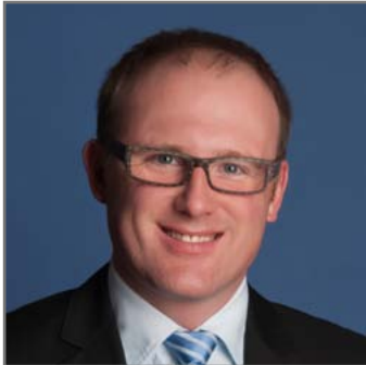
Duisburgs Oberbürgermeister Sören Link.