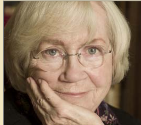
Prof. Jutta Limbach.