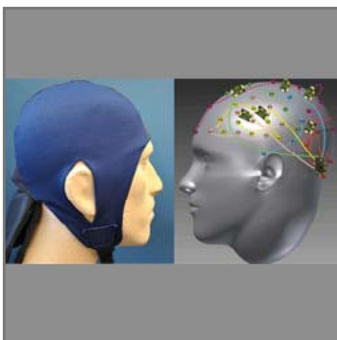
Das drahtlose mobile Multi-ExG-System.

Sie schonen die Patient/innen und machen es auch dem medizinischen Personal einfacher: Zwei vielversprechende Entwicklungen stellen UDE-Wissenschaftler/innen auf der Medica vor (12.-15. November). Die eine ist ein drahtloses mobiles Multi-ExG-System, um Signale von Hirn, Herz oder Muskeln zu übertragen; es kann in eine Mütze oder ein Shirt integriert werden. Die andere ist ein minimal-