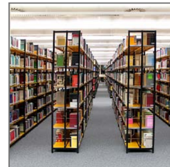
Wieder an ihrem Platz: Die Bücher im 1. Stock der Fachbibliothek.

Über 1.000 Schüler/innen aus mehr als 40 Nationen konnte das Projekt „Förderunterricht für Kinder und Jugendliche mit Migrationshintergrund“ im Schuljahr 2013/14 unterstützen: Eine schöne Bilanz zum 40. Jubiläum der Initiative, bei der Jungen und Mädchen der Klassen 6 bis 13 von mehr als 100 speziell ge- →