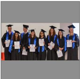
Die stolzen Absolvent/innen mit ihren Urkunden.