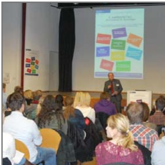
Fachleute geben Tipps für Soziolog/innen.

► https://www.uni-due.de/de/campusaktuell.php?id=5197