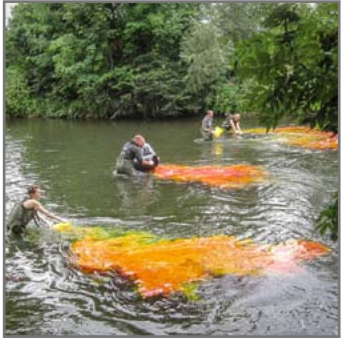
UDE- Forscher/innen bei einem so genannten Tracerversuch auf der Ruhr bei Neheim-Hüsten: Dafür geben sie Farbstoff, der absolut ungiftig und vollständig biologisch abbaubar ist, ins Wasser. So können sie u.a. das Fließverhalten und die Dynamik des Flusses erfassen. Solche Versuche werden sie im Sommer wiederholen.

ung Aquatische Ökologie der UDE. Beteiligt sind 24 Partner aus 16 Ländern, die EU fördert es mit neun Millionen Euro.