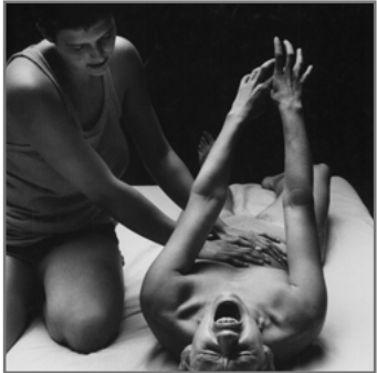
Ein Blick ins Uni-Archiv zeigt: Auch ein Workshop zur Urschrei-Therapie wurde angeboten.