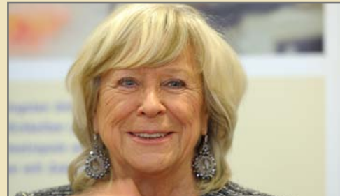
Margarethe von Trotta spricht zum Thema „Annäherung an eine Biographie am Beispiel von Rosa Luxemburg, Hildegard von Bingen und Hannah Arendt“.