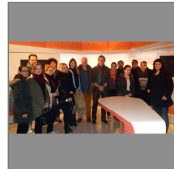
UDE-Studierende zu Gast beim WDR.

► https://www.uni-due.de/de/presse/meldung.php?id=8364