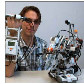
Bauen mit High-Tech-Lego.

► https://www.uni-due.de/de/campusaktuell.php?id=4670