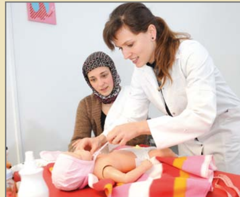
Simulierte Untersuchung mit präparierten Patientenschauspielerin