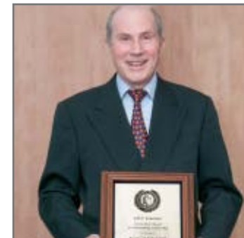
Prof. Raimund Erbel.

Was haben der Eiffelturm oder die Berliner Reichstagskuppel gemeinsam? Es sind markante Stahltragwerk-Konstruktionen mit außerordentlich hoher Stabilität. Dass die entsprechenden Normen auf nationaler und europäischer Ebene stimmig sind, ist auch →