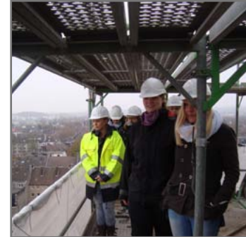
Exkursion mit der Gesellschaft für Bauwerksanierung und Instandsetzung mbH auf das Dach der zu restaurierenden Herz-Jesu Kirche in Dortmund.

► https://www.uni-due.de/de/presse/meldung.php?id=8799