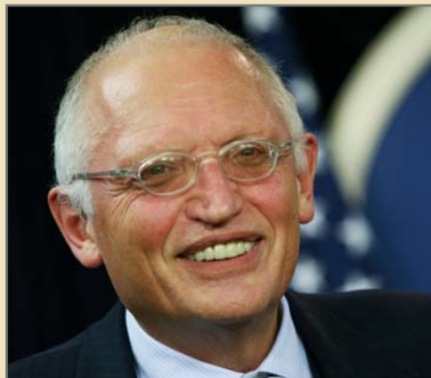
Günter Verheugen.