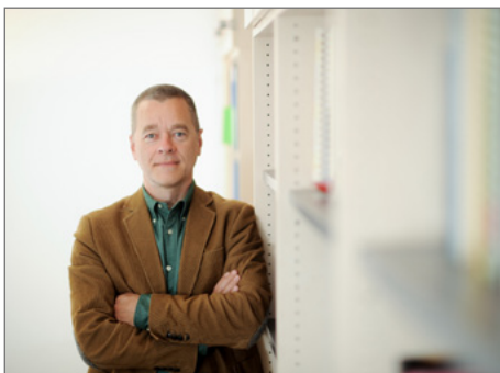
Prof. Andreas Stang

► http://www.asta-due.de/2016/10/die-asta-einstiegsparty-fisimatenten-party-variete/