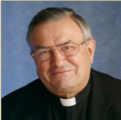
Karl Cardinal Lehmann.