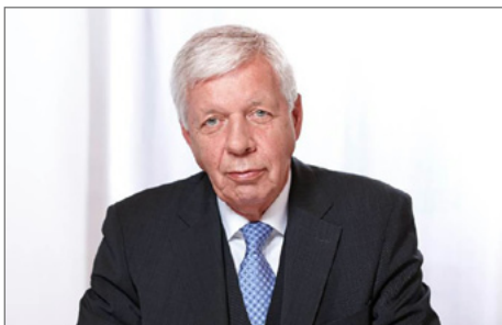
Dr. Werner Müller.

Wie kann Deutschland die ökonomischen und industriellen Herausforderungen der Zukunft meistern? Darüber diskutiert der frühere Bundeswirtschaftsminister und jetzige EVONIK Aufsichtsratsvorsitzende Dr. Werner Müller am 1. Dezember mit Studierenden und Forschenden an der UDE. Per Mail kann man sich zur Veranstaltung am CAR-Institut anmelden.