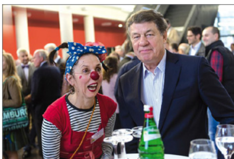
Otto Rehhagel mit einem Klinikclown beim zehnjährigen Jubiläum der Stiftung Universitätsmedizin

► https://www.uni-due.de/de/campusaktuell.php?id=6970