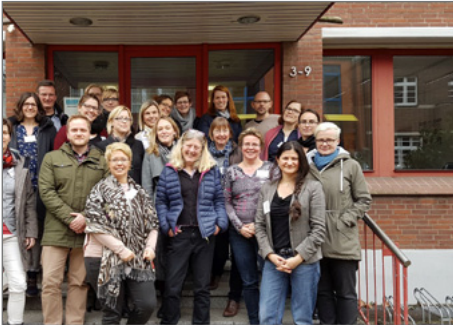
Die Teilnehmenden am Pilotprojekts „KomDiM-Profi LS “.