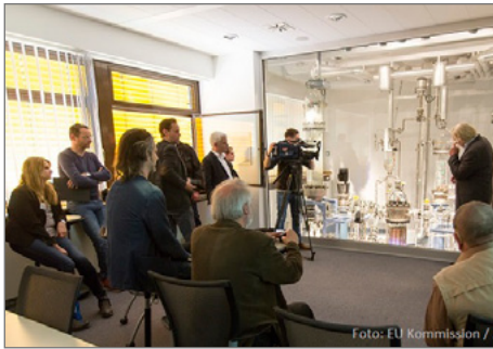
Den Besuch begleitete auch ein privater Fernsehsender.