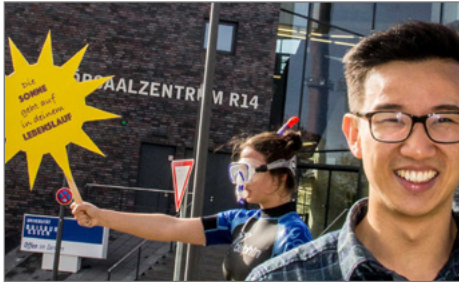
„Die Sonne geht auf in deinem Lebenslauf“: Der Wegweiser-Slogan.