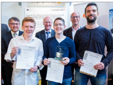
Belegten den ersten Platz: Schüler des Don-Bosco-Gymnasiums aus Essen mit ihrem Lehrer.

► https://www.uni-due.de/in-east/news.php?id=134