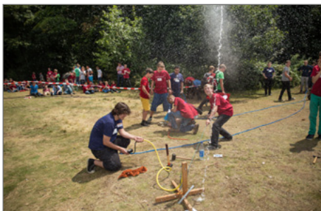
Eine Wasserrakete in Aktion.