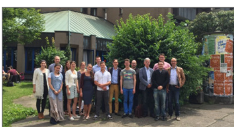
Sahen sich in Essen um: Angehende Geschichtslehrer/innen aus Gouda.

► http://www.energieagentur.nrw/brennstoffzelle/11._wettbewerb_fuelcellbox_2016