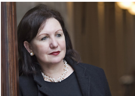
Prof. Seyla Benhabib ist Scientist in Residence.

Was haben Demokratie, Migration und Globalisierung miteinander zu tun, fragt die renommierte amerikanische Wissenschaftlerin Seyla Benhabib. Die Professorin für Politische Theorie und Politische Philosophie der Yale University kommt 2017 als „Scientist in Residence“ an die UDE. Sie hält am 26. Januar eine öffentliche Vorlesung. Beginn: 18 Uhr, Ort: Neues Audimax (Campus Essen). Anmeldung erforderlich.