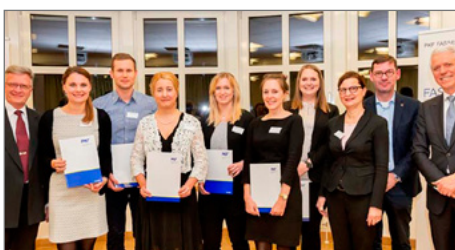
Gruppenbild mit Ausgezeichneten: Sechs MSM-Absolvent/innen erhielten den Fasselt-Förderpreis.

► https://www.uni-due.de/konfuzius-institut/ki_preis_2016.php