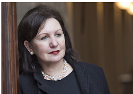
Prof. Seyla Benhabib ist Scientist in Residence.

Was haben Demokratie, Migration und Globalisierung miteinander zu tun, fragt die renommierte amerikanische Wissenschaftlerin Seyla Benhabib. Die Professorin für Politische Theorie und Politische Philosophie der Yale University kommt 2017 als „Scientist in Residence“ an die UDE. Sie hält am 26. Januar eine öffentliche Vorlesung. Beginn: 18 Uhr, Ort: Neues Audimax (Campus Essen). Anmeldung erforderlich.