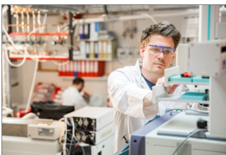
Blick in ein konventionelles Lobar.

► https://www.uni-due.de/de/presse/meldung.php?id=9672