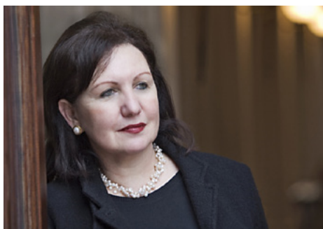
Prof. Seyla Benhabib ist Scientist in Residence.

Was haben Demokratie, Migration und Globalisierung miteinander zu tun, fragt die renommierte amerikanische Wissenschaftlerin Seyla Benhabib. Die Professorin für Politische Theorie und Politische Philosophie der Yale University kommt 2017 als „Scientist in Residence“ an die UDE. Sie hält am 26. Januar eine öffentliche Vorlesung. Beginn: 18 Uhr, Ort: Neues Audimax (Campus Essen). Anmeldung erforderlich.