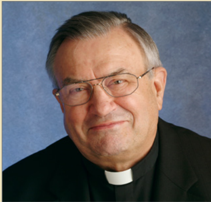
Kardinal Lehmann hält seinen zweiten Vortrag am 17. Januar.