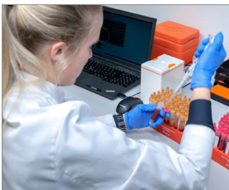
Im neuen Ultratiefkühlager.