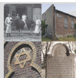
Landjuden im Rheinland

► https://www.uni-due.de/2017-10-26-iuta-workshops