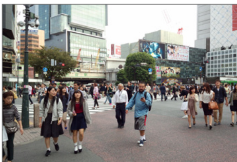
Smartphone-Nutzer auf der berühmten Shibuya-Kreuzung in Tōkyō.

► https://www.uni-due.de/cenide/symposium_synthesis_2017.php