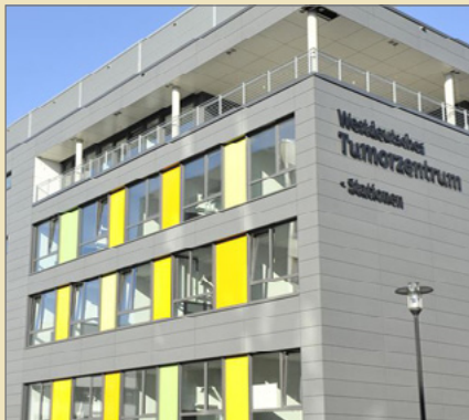
Das Bettenhaus des Westdeutschen Tumorzentrums mit Innerer Klinik (Tumorforschung).