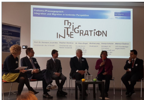
Das Forschungszentrum InZentIM wurde im Beisein von hochrangigen Gästen eröffnet.

► https://www.uni-due.de/de/presse/meldung.php?id=9722