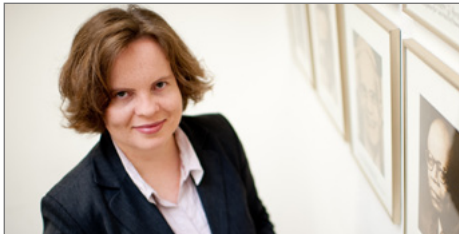
Erstellte die Studie gemeinsam mit einem Kollegen vom RWI: Prof. Marie Paul.