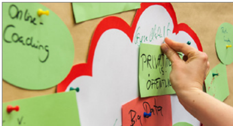
Brainstorming bei der Auftaktveranstaltung zum letzten GYF-Jahrgang.

► https://www.uni-due.de/aktuell/artikel.php?mode=article&articles=701