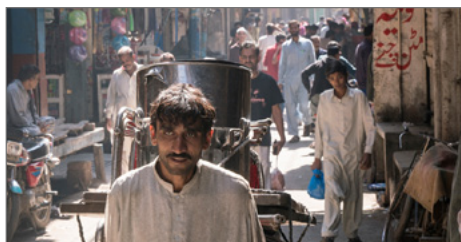
Blick in eine Straße, Lahore (Pakistan).