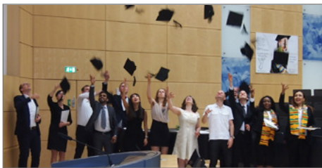
Jubel: Masterstudierende bei ihrer Verabschiedung.

► https://www.uni-due.de/2017-05-30-studierende-motivieren