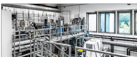
Blick auf die obere Etage der Nanopartikelsyntheseanlage im NanoEnergieTechnikZentrum.

► https://www.uni-due.de/2017-08-28-millionenfoerderung-fuer-nanolego