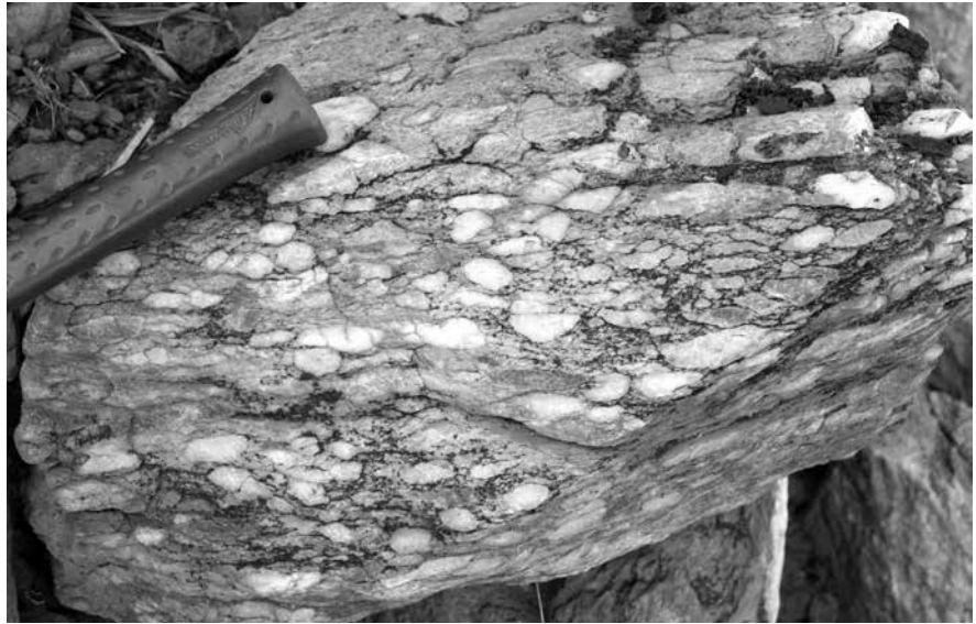
(2) Ca. 3 Mia. Jahre altes Sedimentgestein (Konglomerat) mit hydrothermalen Quarzgeröllen, Jack Hills, Australien.

In der technischen Chemie werden mit Hilfe der Fischer/Tropsch-Synthese unter hohen Drucken und Temperaturen aus Kohlenmonoxid und Wasserstoff langkettige organische Moleküle hergestellt (z.B. für Benzin). Verschiedene metallische Katalysatoren sorgen für eine hohe Ausbeute bei der Reaktion. Gleiche Voraussetzungen sind und waren in der Erdkruste vorhanden. Die Bruchzonen sind rau und bieten eine hohe Zahl an kleinen Vorsprüngen und Taschen, in denen sich aufsteigende Gase sammeln können. Gase nehmen ab einer spezifischen Temperatur und einem spezifischen Druck einen besonderen Phasenzustand ein. Sie werden überkritisch, ihre Dichte beträgt etwa die Hälfte von der einer Flüssigkeit. Für \text{CO}_2 findet der Übergang in der Kruste ab etwa 750 Metern Tiefe statt. Darunter verhält sich das überkritische \text{CO}_2 wie ein organisches Lösungsmittel, das gleichzeitig eine sehr niedrige Oberflächenspannung besitzt. In ihm können unpolare organische Substanzen gelöst werden, die im Wasser nicht löslich sind. Da die Dichte von überkritischem \text{CO}_2 geringer ist als Wasser, steigt es aus der Tiefe in Form von Tropfen auf und transportiert Moleküle zur Oberfläche, die unter höheren Dru-