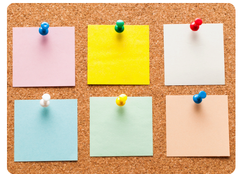
Arbeitsaufträge via Post it