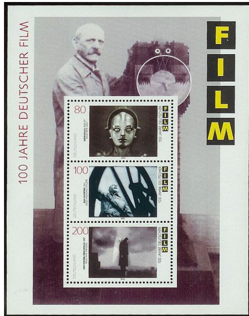
(Briefmarkenblock 100 Jahre Film, Deutschland 1995)