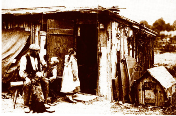
Hütte in Hamburg-Billbrook. In: Die Zeiten ändern sich, Hamburg 1899)