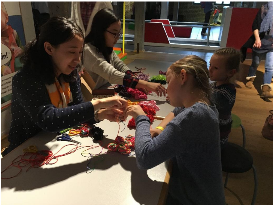
老师们教孩子编织手环