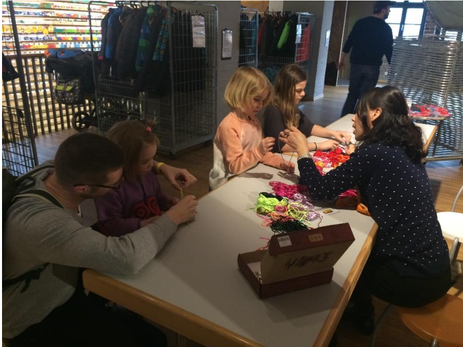
孩子们专心致志地学习