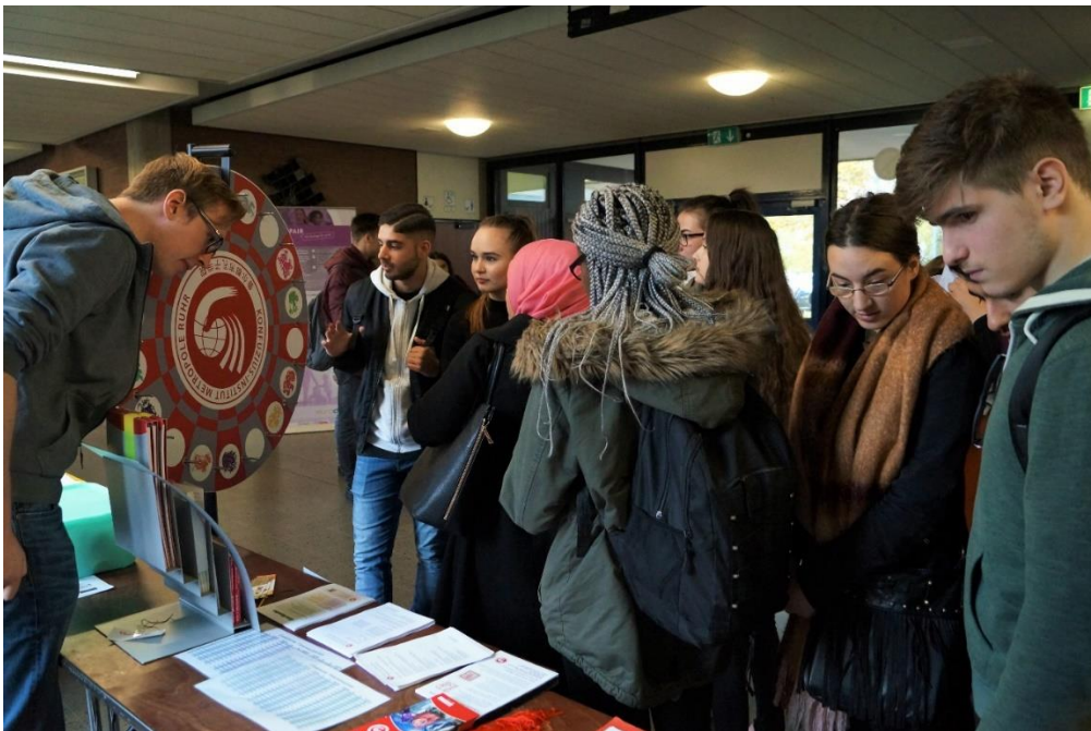
孔子学院的人气展台

当地时间 11 月 3 日，杜伊斯堡中学生教育与职业推介会在杜伊斯堡南部的贝托尔特·布莱希特职业学校（Bertolt-Brecht-Berufskolleg）举办。鲁尔都市孔子学院受邀参加此次推介会，受到了师生和参观者的欢迎。