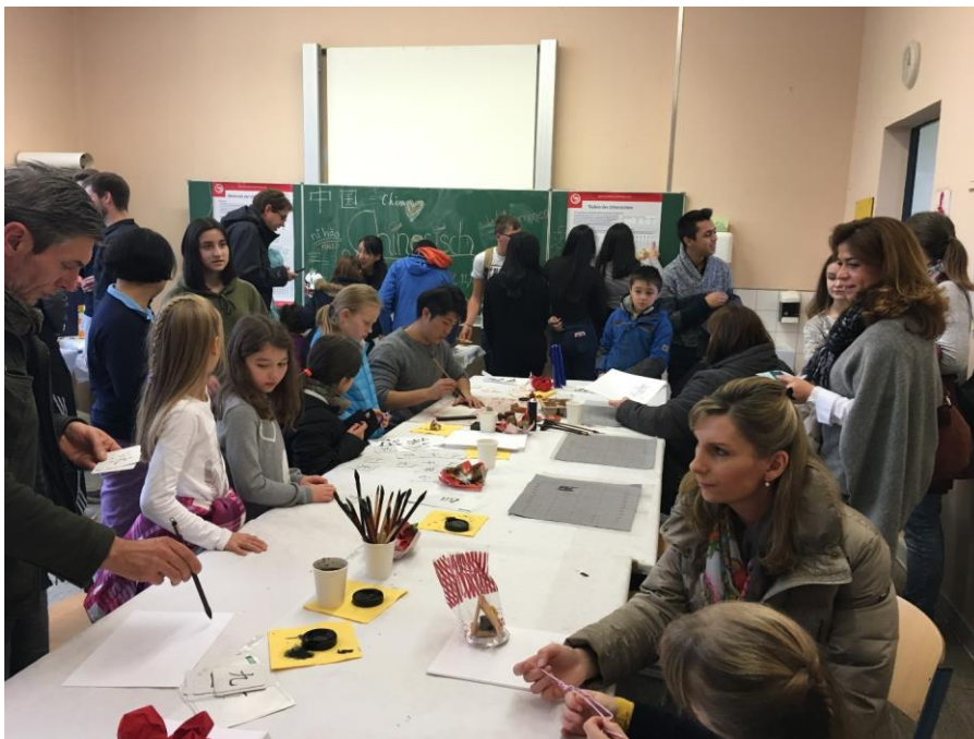
熙熙攘攘的中文展厅

当地时间 11 月 26 日上午，鲁尔都市孔子学院应邀参加了杜伊斯堡市兰德费尔曼高级文理中学（Landfermann Gymnasium）一年一度的校园开放日活动。尽管天气寒冷，典雅复古的教学楼里却一派热闹的气氛，前来参观咨询的家长 and 孩子们络绎不绝。曾在两周前埃森市伯乐高级文理中学（Burggymnasium Essen）开放日上受到热捧的鲁尔都市孔子学院，当天再次成为大家关注的焦点。