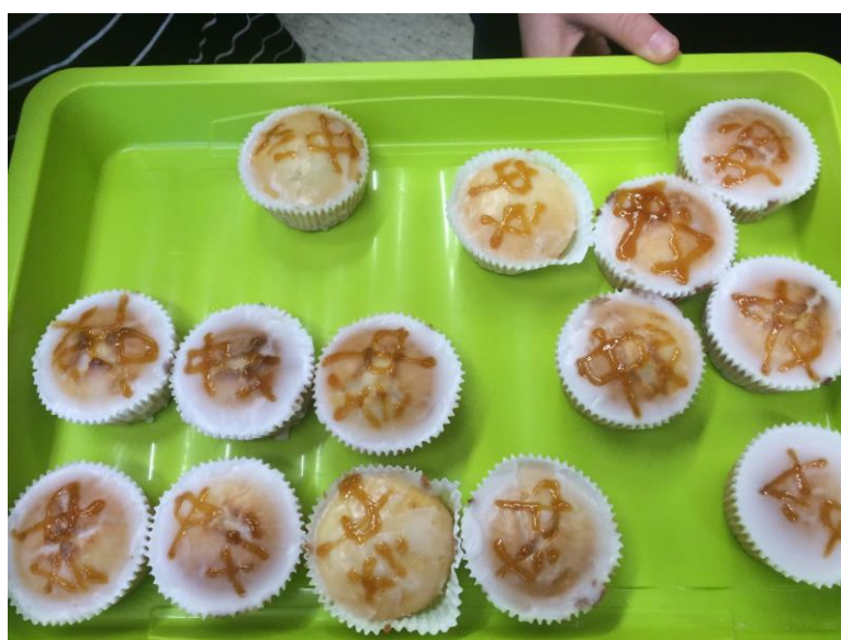
有颜值有内涵的“中文”蛋糕