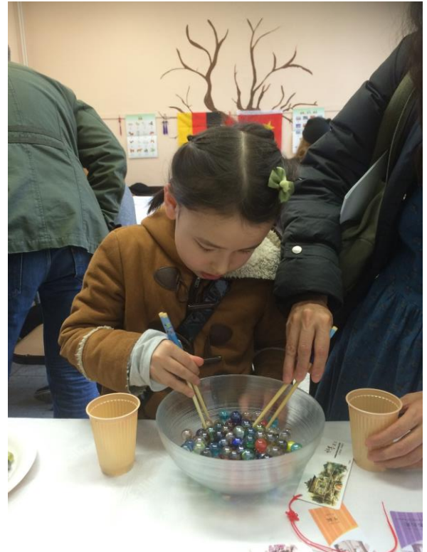
专心夹珠子的小女孩