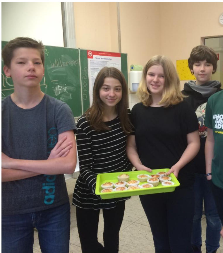
德国孩子展示自己烤的“中文”小蛋糕

纸砚，更让他们忍不住走上前来看一看摸一摸。鲁尔都市学院为本次校园开放日做了精心且充分的准备，中文班的德国孩子们还自己烤制了写着“中文”字样的小蛋糕，现场免费提供。这批有颜值有内涵的蛋糕受到参观者的热情追捧，不到一小时就告罄了。