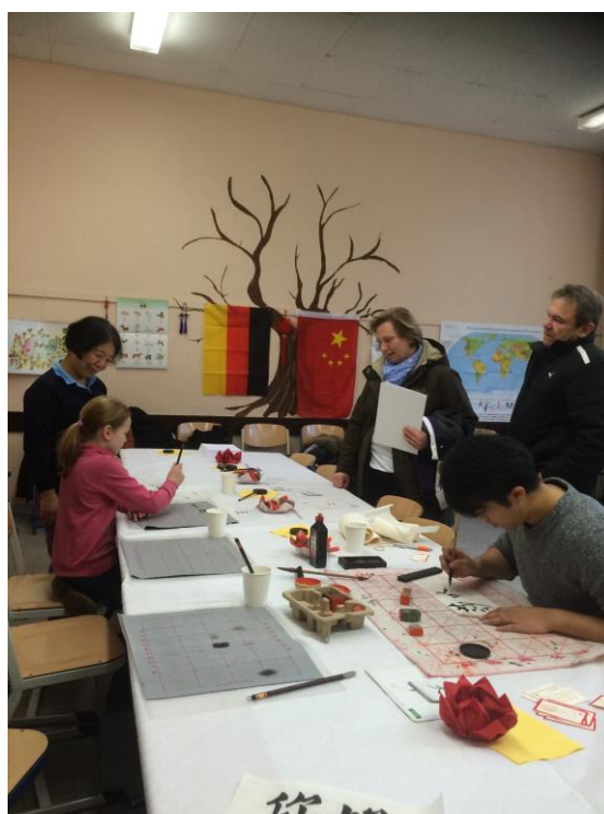
孔院赵老师欣然挥毫