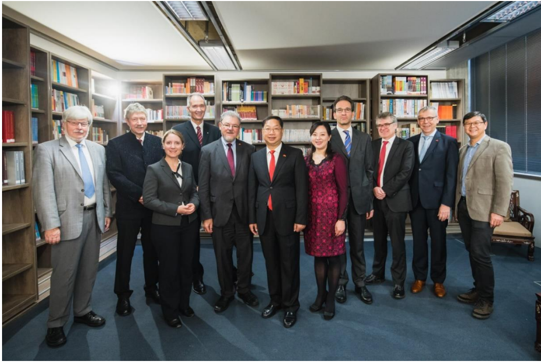
大使与杜伊斯堡市政府、杜埃大学和孔院代表合影