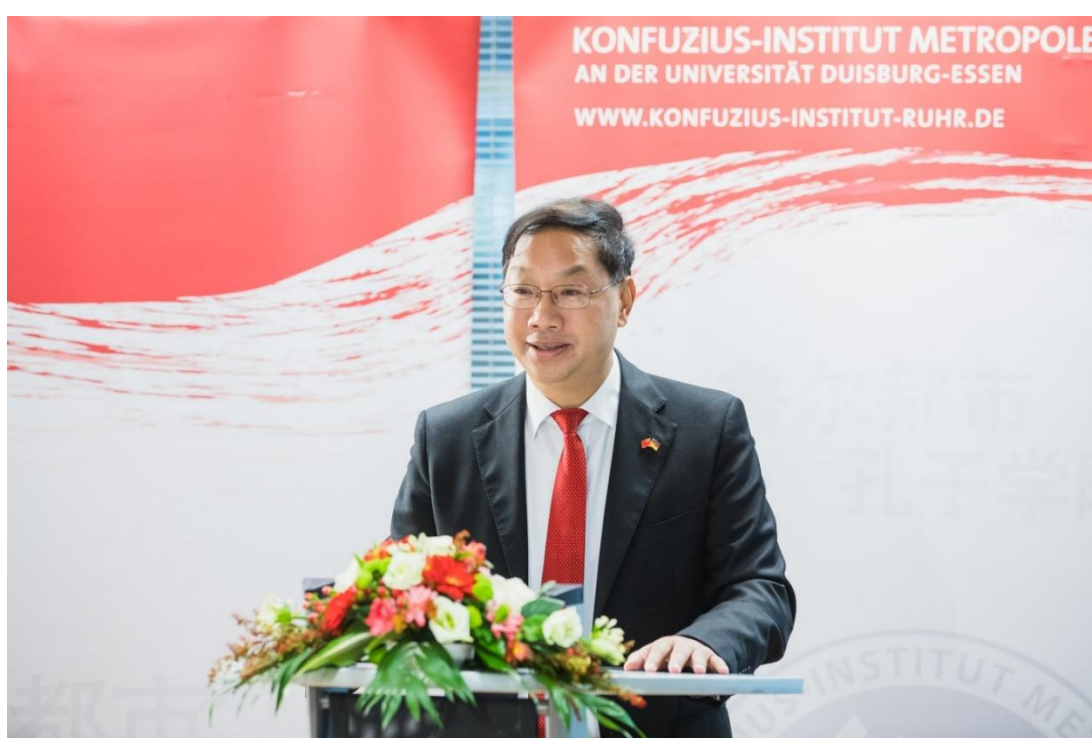
史明德大使发表演讲

有不少相似之处，两国的关系可以说是中欧关系的代表。中德合作有很大的潜力，因而中德两国更需要加强交流，在此过程中，面对面的交流尤其重要。孔院作为近年来中德人文教育交流的重要平台之一，应该发挥更大的作用。同时大使也坦言，虽然中国在过去四十年里发展迅速，但是与德国这样的发达国家相比，始终存在很大的差距，中国正在努力不断提高经济发展质量和人民生活水平。随后的提问环节，观众踊跃参与，抛出不少角度新颖的问题，大使旁征博引，应答如流，并反复强调当今世界是一个多极化的世界，尊重他国的历史和国情，包容互鉴尤为重要。同时他还表示，只是通过媒体报道了解中国必将是管中窥豹，希望外国朋友们能亲身体会中国，形成与实情相符的中国印象。