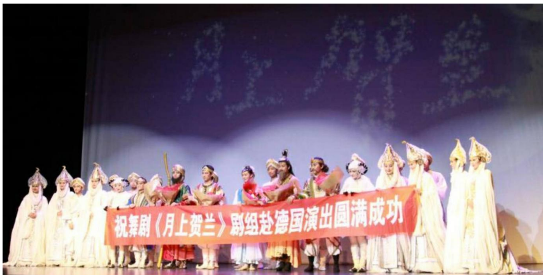
《月上贺兰》赴德巡演剧组

为了让更多德国民众感受到中国艺术的魅力，《月上贺兰》剧组还应特里尔孔院的邀请前往德国莱法州及邻国卢森堡演出，将艺术之花播撒得更广。这也是德语区孔子学院横向合作、资源共享的一次成功尝试。