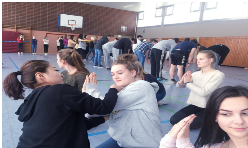
孩子们认真学习舞蹈