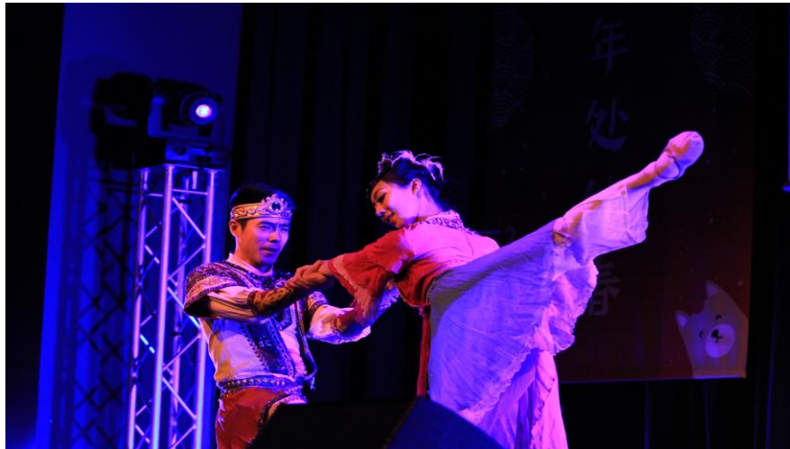
全情投入的男女主角