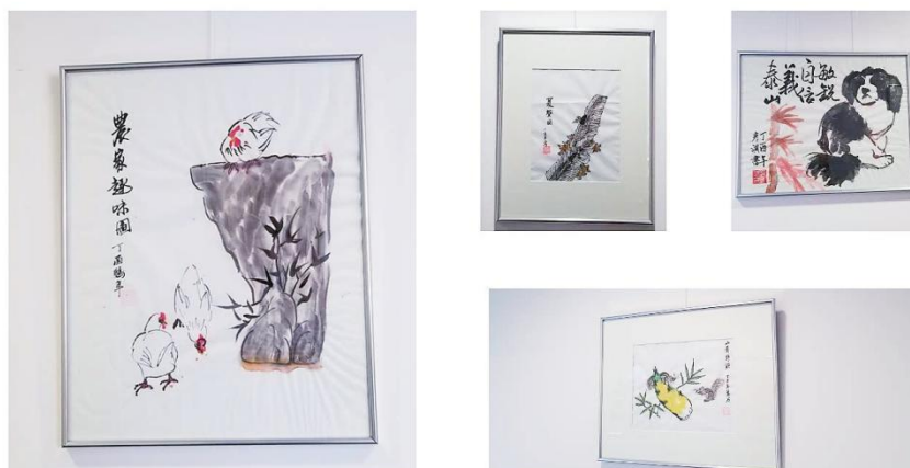
生动活泼的国画动物