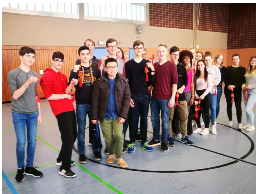
优胜小组师生全家福