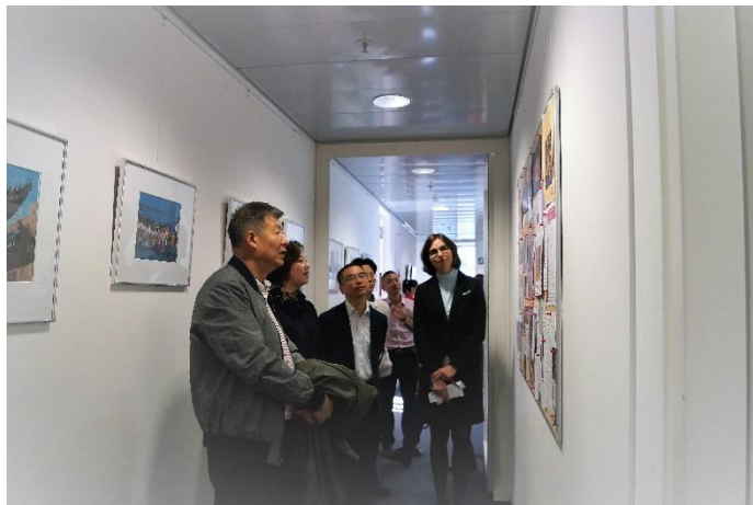
工作人员向韩进书记介绍孔院宣传栏

20 日上午十一时许，代表团抵达鲁尔都市孔子学院，孔院中外方工作人员热情地接待了代表团。韩进书记对大家表示亲切的慰问，并举行座谈会，询问孔院的发展状况以及近年来举办的文化活动和语言教授等情况。