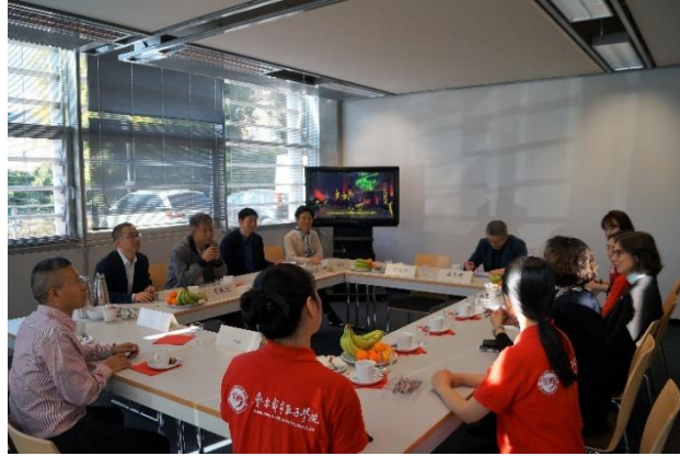
武大代表团与孔院中外方工作人员座谈