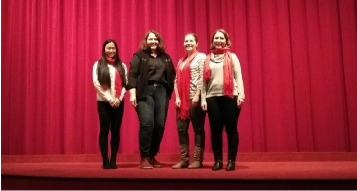
孔院工作人员与电影院负责人合影留念

中国传统文化中认为，生命就是周而复始，死亡不是终结，而是另一种新生，一切都是这么神奇。虽然有危险，有困顿和苦难，但苦难中也有希望与爱，在苦难中成长，坚强、坚定、快乐，生命因此生生不息。我们希望通过这部电影，不仅能让孩子们领略到中国的自然之美，还能让他们在成长之路上回想起这部电影时，能被电影里的生命之美所感动从而获得力量。