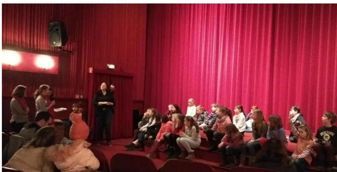
孩子们踊跃参与互动，积极提问

影片结束后，孔院工作人员还特地为孩子们准备了形式丰富的互动活动，现场气氛热烈而温馨。问答环节，孩子们带着儿童特有的浓厚好奇心踊跃参与，充满童趣的问题不断，孔院工作人员也热情耐心地解答他们的疑问。问答环节结束后，是广受喜爱的大明星“熊猫”的专场秀。孩子们不仅能参与熊猫涂鸦，根据自己的爱好给心中的大熊猫穿上鲜艳的衣服，还能学习汉字“熊猫”的读音和写法。兴趣是最好的老师，短暂的教学以后，孩子们俨然成为了“熊猫专家”，字正腔圆的发音和工整的汉字让孔院的中国老师都赞叹不已。