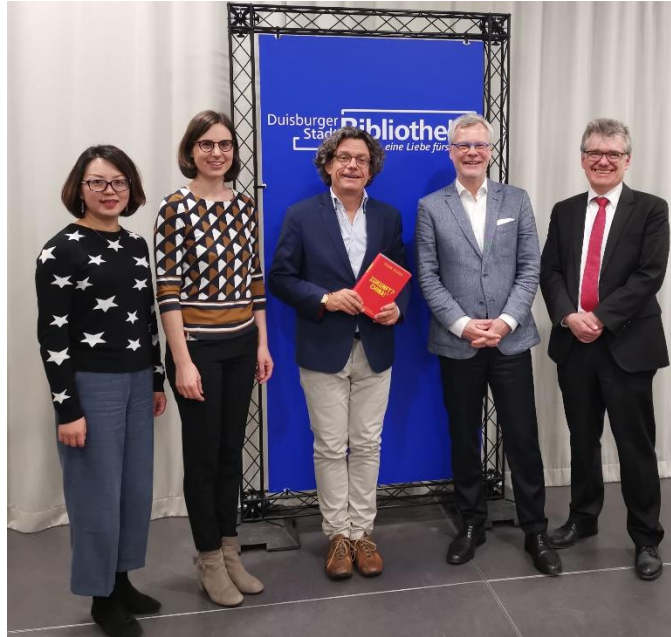
主办方与报告人泽林先生合影留念

泽林先生十分风趣，台下听众从二十来岁的年轻人到六七十岁的老年人，都对他的演讲赞誉有加。去过中国的年轻人对于他的演讲内容更是十分认同。报告和提问环节之后，现场还举行了小型的签售会，主办方准备的书籍被一抢而空。