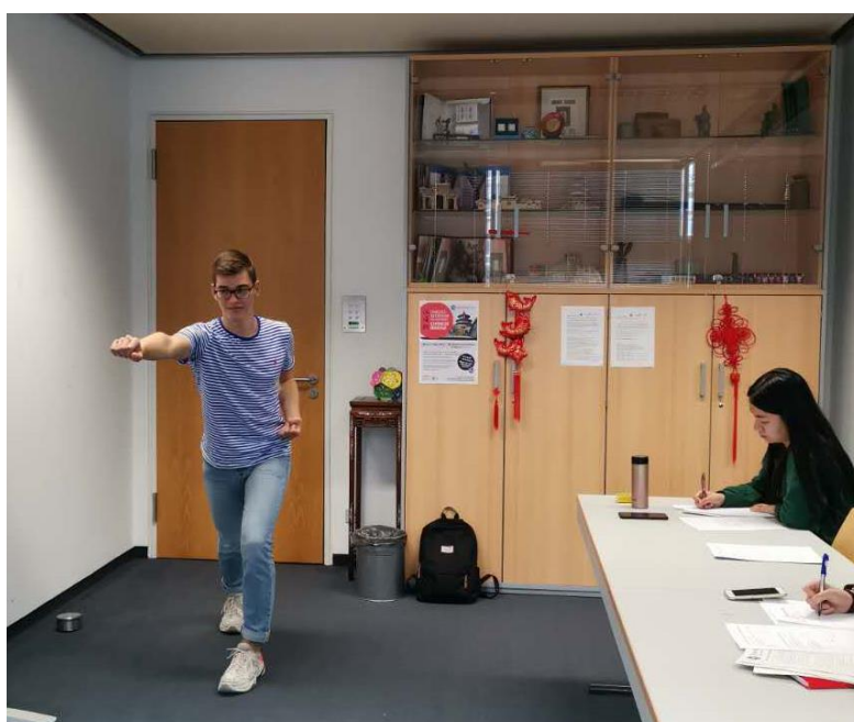
雅德芬文理中学的兰波表演武术

第二部分是知识问答环节，这个部分对于德国学生来说，存在一定难度，题目不仅涉及中国传统文化，民风民俗，还有汉语语法知识，大部分学生都觉得很有压力，但是也有“种子”选手能够全部答对。