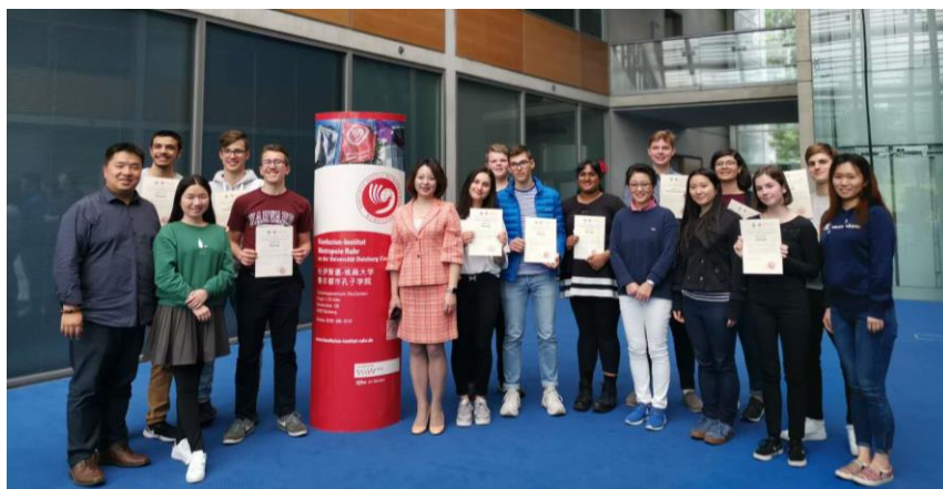
全体师生合影留念

以上获奖选手将于6月15日赴不来梅参加第十二届“汉语桥”中学生中文比赛德语区决赛，希望他们在接下来的一个月里再接再厉，努力备赛，在决赛中创造更加优异的成绩。