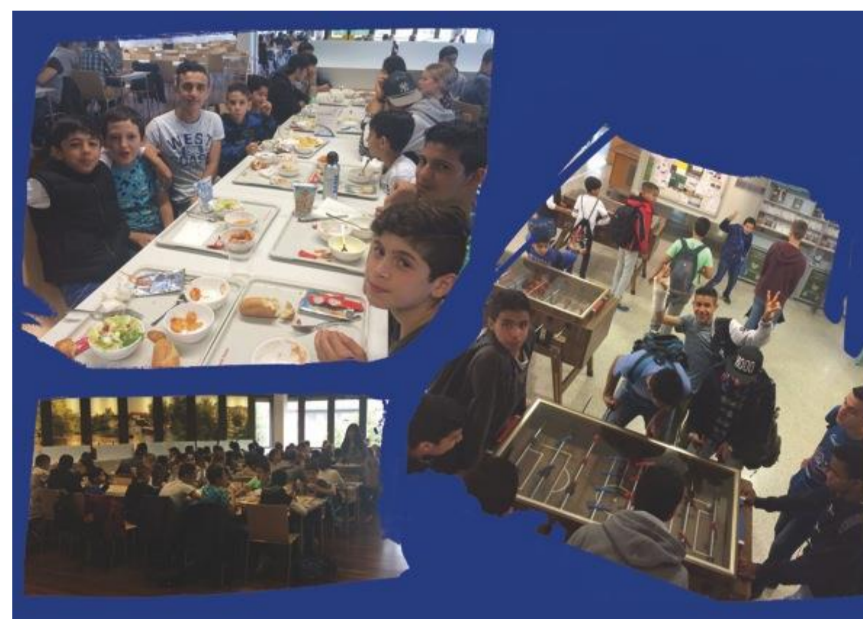
Mittags gemeinsames Essen in der Mensa