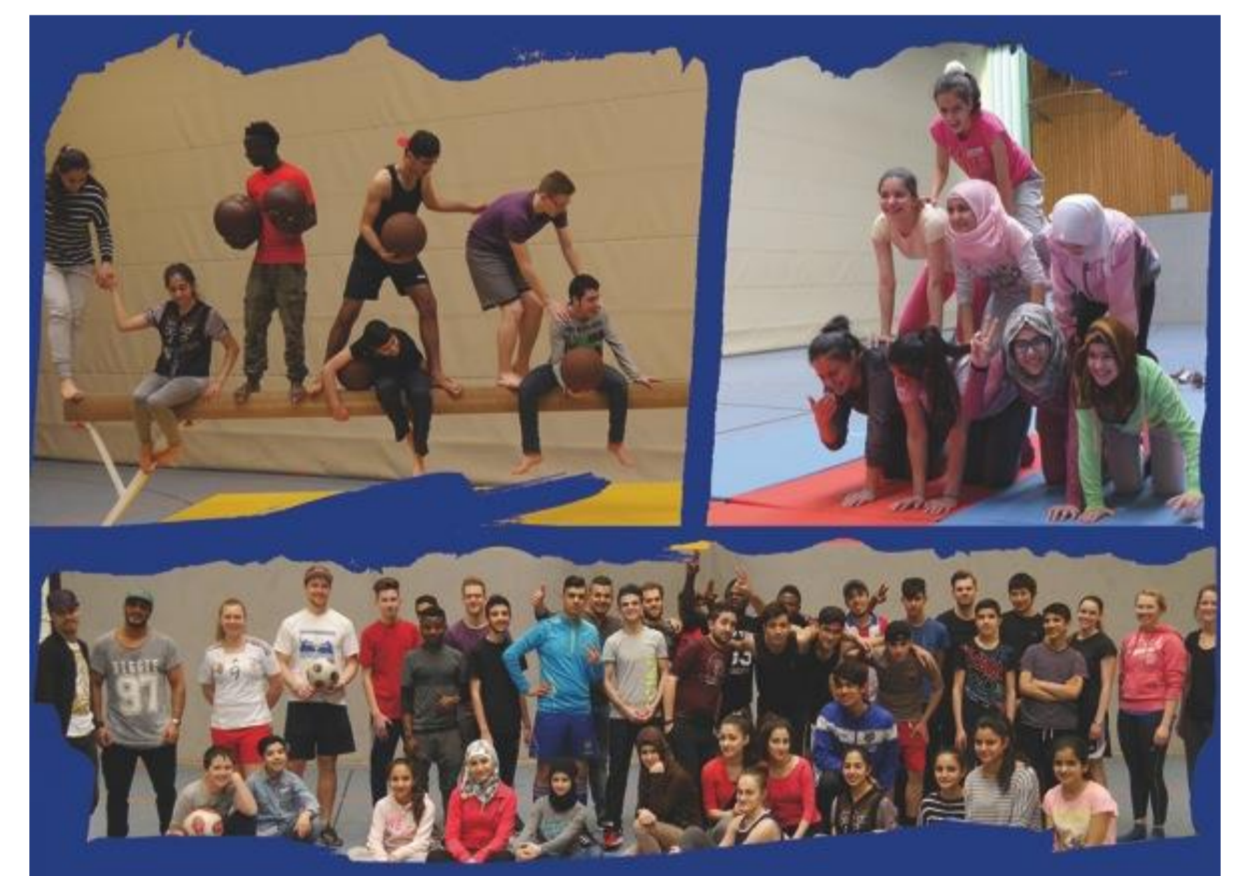
Nachmittags Sprechen und Bewegen am Sportcampus