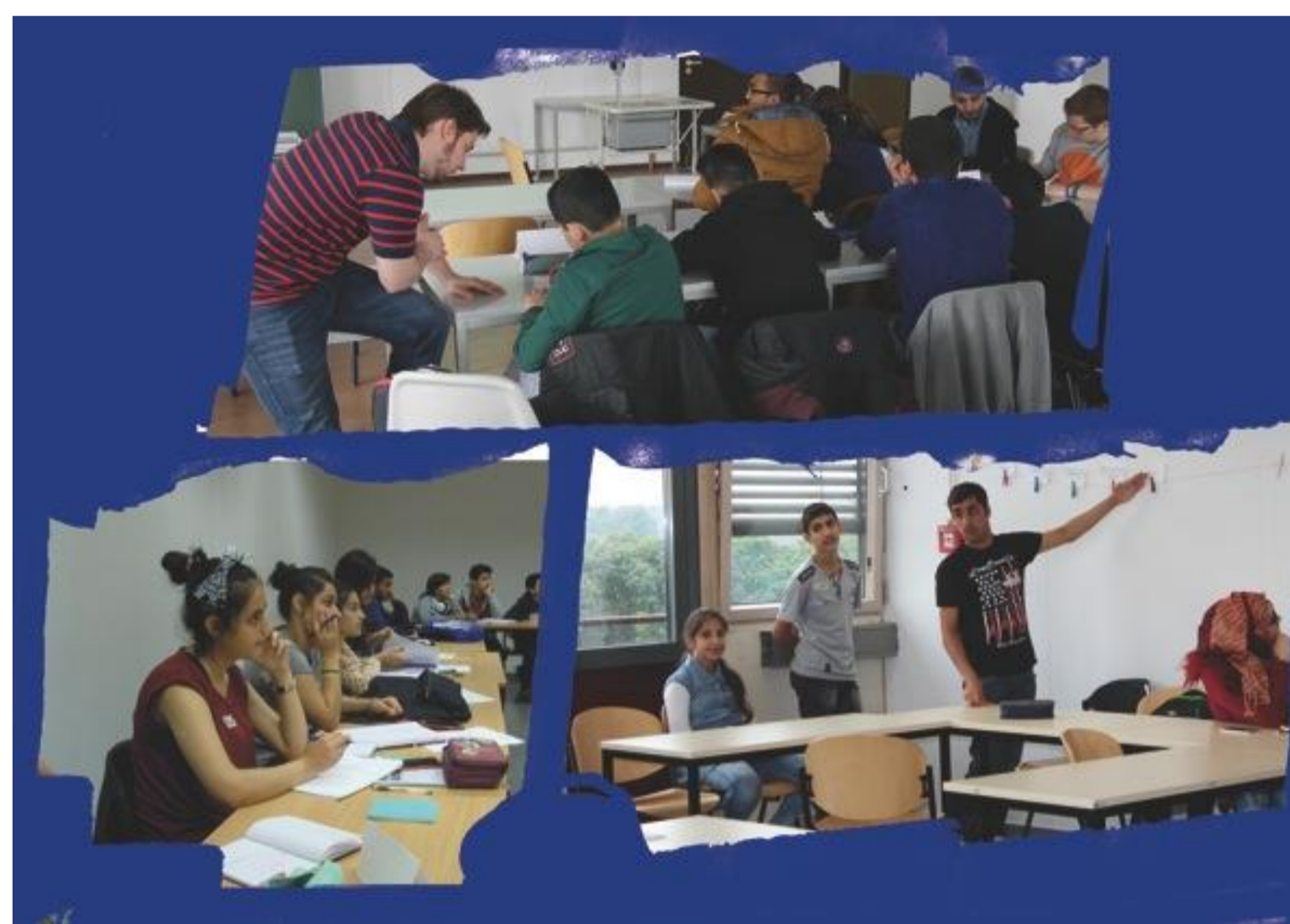
Vormittags Sprachkurse am Campus Essen