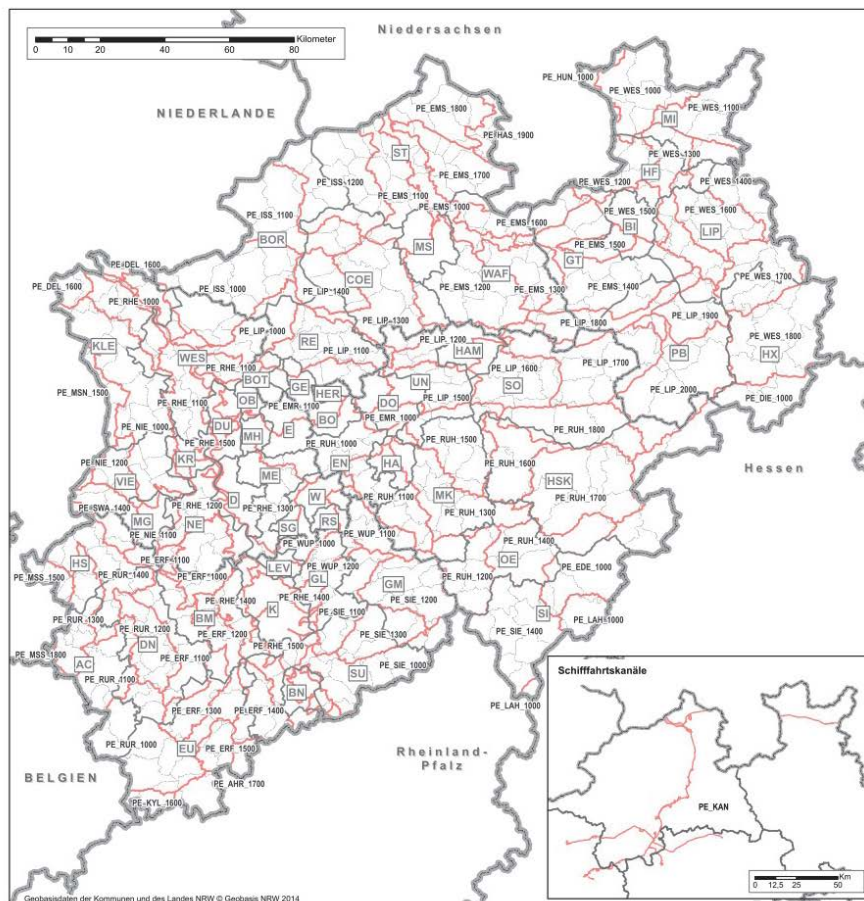
Planungseinheiten und Verwaltungsgrenzen in NRW