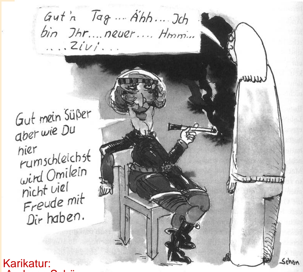
Karikatur: Andreas Schön