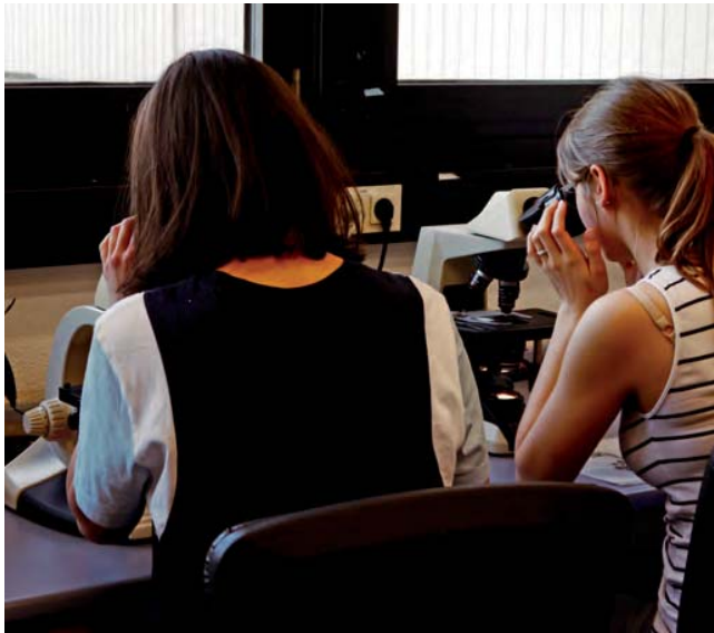
Einblicke in den Forschungsalltag...